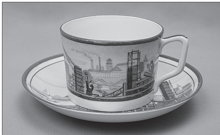
Рис. 5 Чашка с блюдцем (1920–1930-е гг.). Завод «Пролетарий». Новгородский музей-заповедник, Великий Новгород

Развитие завода «Пролетарий» приостановила Великая Отечественная война, и продукция довоенного периода сохранилась очень скудно.