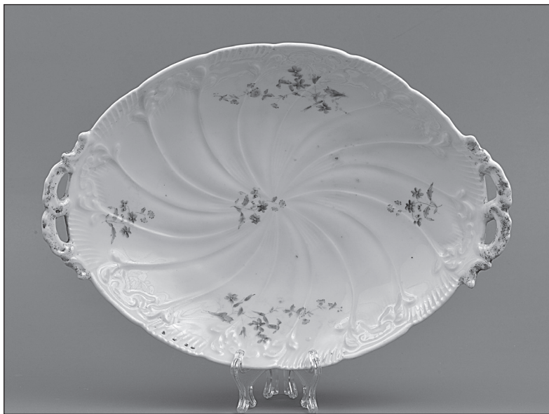
Рис. 2 Блюдо (1878–1917 гг.). Фабрика И.Е. Кузнецова на Волхове. Новгородский музей-заповедник, Великий Новгород

выпускалась на предприятии. Фарфор не уступал по качеству образцам китайского и западноевропейского фарфора, обладая тонкостью, белизной и чистотой звона.