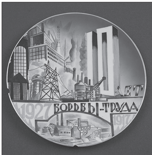
Рис. 10 Тарелка (1927 г.). Завод «Красный фарфорист». Новгородский музей-заповедник, Великий Новгород