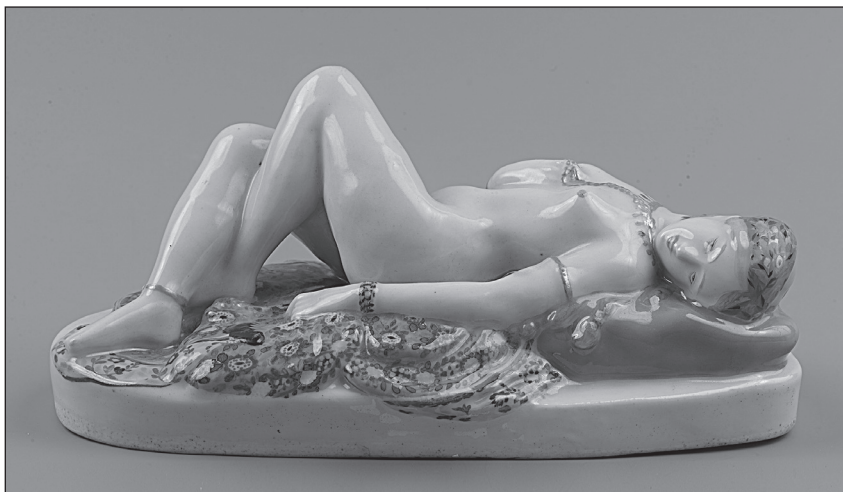
Рис. 3 З.В. Кобылецкая. Скульптура «Одалиска» (1924 г). Государственная Волховская фарфорово-фаянсовая фабрика «Коминтерн». Новгородский музей-заповедник, Великий Новгород