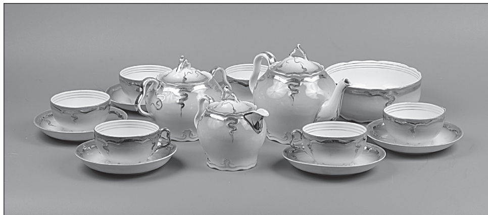
Рис. 9 Сервиз чайный (1900–1917 гг.). Грузинская фарфорово-фаянсовая фабрика И.Е. Кузнецова. Новгородский музей-заповедник, Великий Новгород

В 1897 г. Иван Емельянович Кузнецов основал Грузинскую фарфорово-фаянсовую фабрику около поселка Чудово Новгородской губернии. Уже в 1902 г. посуда фабрики была востребована царским двором, а с 1904 г. фабрика стала Поставщиком Двора Его Императорского Величества. В коллекции Новгородского музея-заповедника хранится чайный сервиз, выпущенный на Грузинской фабрике (1900–1917), сохранившийся в полном объеме (рис. 9). Сервиз декорирован градиентной заливкой фона и золотым рельефом.