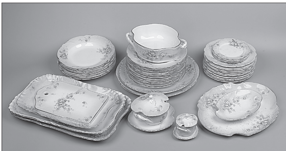
Рис. 1 Столовый сервиз (XX в., начало). Фабрика И.Е. Кузнецова на Волхове. Новгородский музей-заповедник, Великий Новгород

Фарфор, произведенный на Волховской фабрике И.Е. Кузнецова, представлен в фондах Новгородского музея-заповедника и Музея художественной культуры Новгородской земли. В основном это единичные предметы из наборов сервизов посуды, но сохранились и комплекты, например часть столового набора (XX в., начало) из фондов Новгородского музея-заповедника (рис. 1).