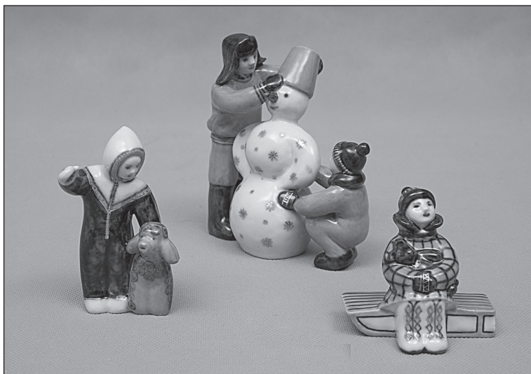
Рис. 8 Т.А. Гаврилова. Композиция скульптурная «Зимние забавы» (1990 г.). Завод «Возрождение». Новгородский музей-заповедник, Великий Новгород