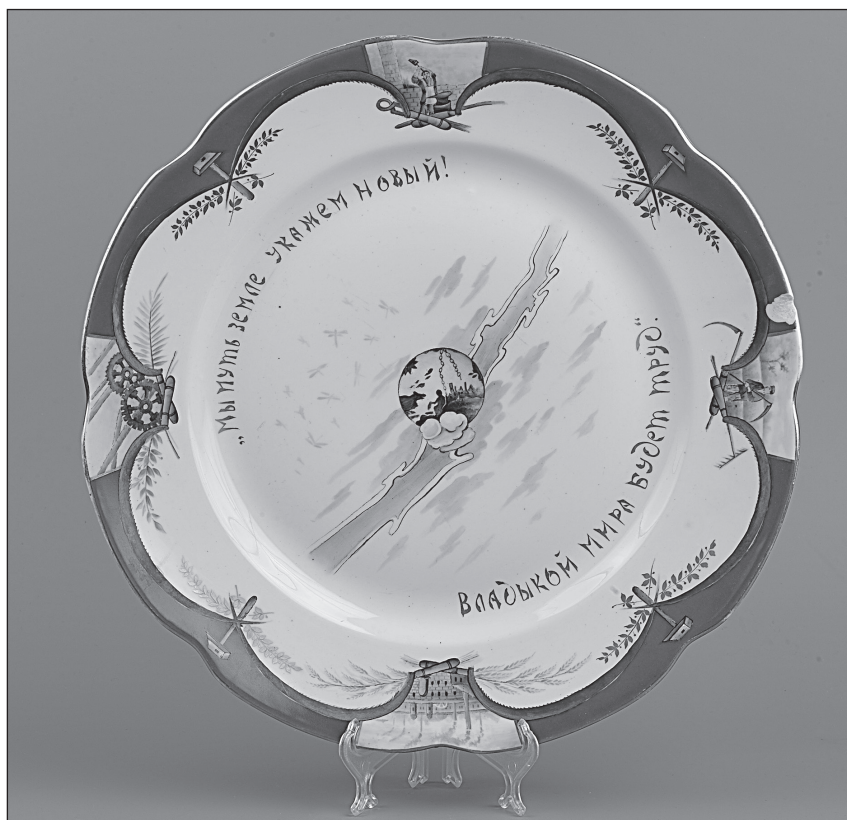
Рис. 4 Блюдо (1926 г.). Государственная Волховская фарфорово-фаянсовая фабрика «Коминтерн». Новгородский музей-заповедник, Великий Новгород