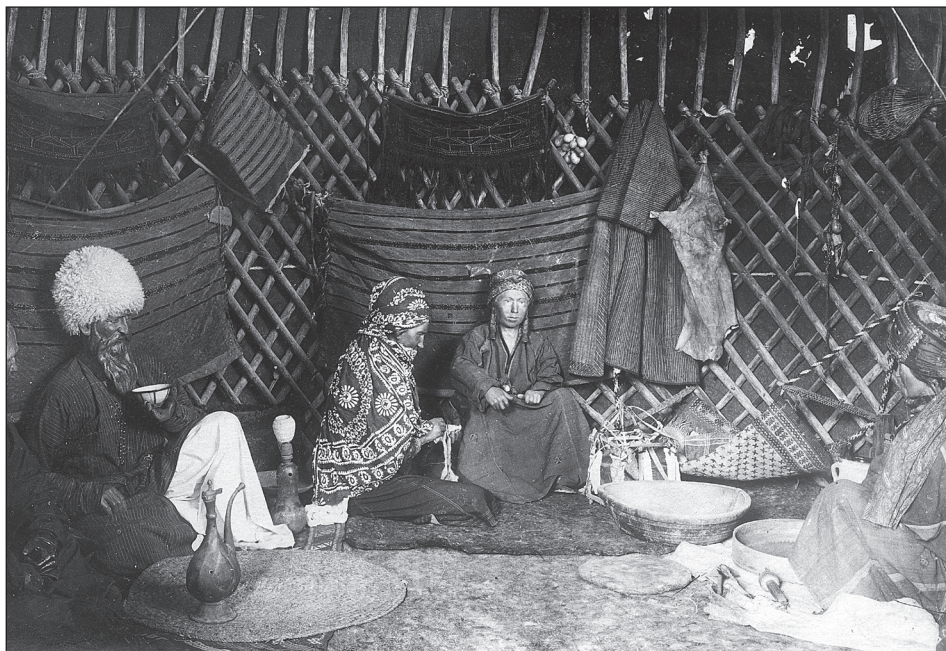
Рис. 1 Интерьер туркменской юрты. Экспозиция «Туркмены». 1938 г.

(1939 г.) на экспозиции «Народы Северного Кавказа в прошлом и настоящем» в зале был построен бревенчатый дом с земляной крышей. Обстановочная сцена демонстрировала хозяина дома за едой и хозяйку, которая стоит у дверей. Под навесом две женские фигуры занимались ткачеством 29 . При показе интерьера туркменской юрты (1938 г.) была использована обстановочная сцена, демонстрирующая отдыхающих мужчин — хозяина юрты и его гостя, а также женщин за домашней работой (рис. 1) 30 .