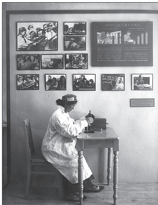
Рис. 2 Раздел «Просвещение». Часть экспозиции «Узбеки в прошлом и настоящем». 1935 г.

месте было немислимым. Советская красная чайхана была создана с совершенно иной целью — она должна была стать культурным центром, площадкой для обучения и ликвидации безграмотности. Красная чайхана была открыта для женщин: «в начале 1936 г. было решено создать женский клуб на базе одной из красных чайхан ...» 41 . Таким образом, обстановка сцена демонстрирует новое положение женщины в советском обществе: она не просто получает доступ в общественное пространство, но находится в центре него, занимаясь общественно полезным делом — созданием стенгазеты.