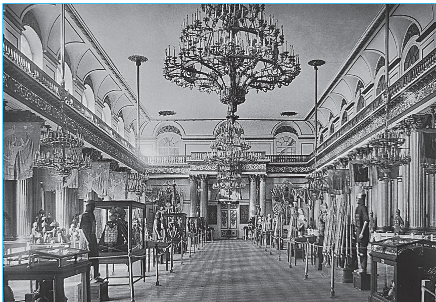
Рис. 4 Экспозиция Арсенала в Гербовом зале. Фотография. 1925 г.

истории и культуры Востока и Запада в тесной связи, признававшие значительную роль восточных народов в создании и развитии мировой культуры. Именно по инициативе этих ученых в 1920 г. в Эрмитаже было создано Отделение мусульманского Востока (мусульманского средневековья), а его хранителем назначен И.А. Орбели, который в 1922 г. инициировал его переименование в Отделение Кавказа, Ирана и Средней Азии, а в 1926 г. — преобразование в Отдел Востока 40 . Создание экспозиции, демонстрирующей культуру и искусство Востока, в одном музее, рядом с экспозициями западноевропейского искусства, античной культуры и др., визуализировало бы вышеназванные представления востоковедов 41 . Если говорить о политической стороне вопроса, отмеченной Ю.А. Пятницким 42 и Б.Б. Пиотровским 43 , то восточная экспозиция с акцентом на Среднюю Азию и Кавказ могла служить значительным оружием пропаганды. Здесь можно упомянуть как Декларацию прав народов России 1917 г. (равенство народов, отмена национальных привилегий и ограничений), так и установление советской власти в Средней Азии в 1920 г., а также сложности с Закавказьем, существовавшие на момент создания Отделения мусульманского Востока (часть Закавказья, Армения и Грузия не находились под контролем советской власти, там были созданы национальные образования).