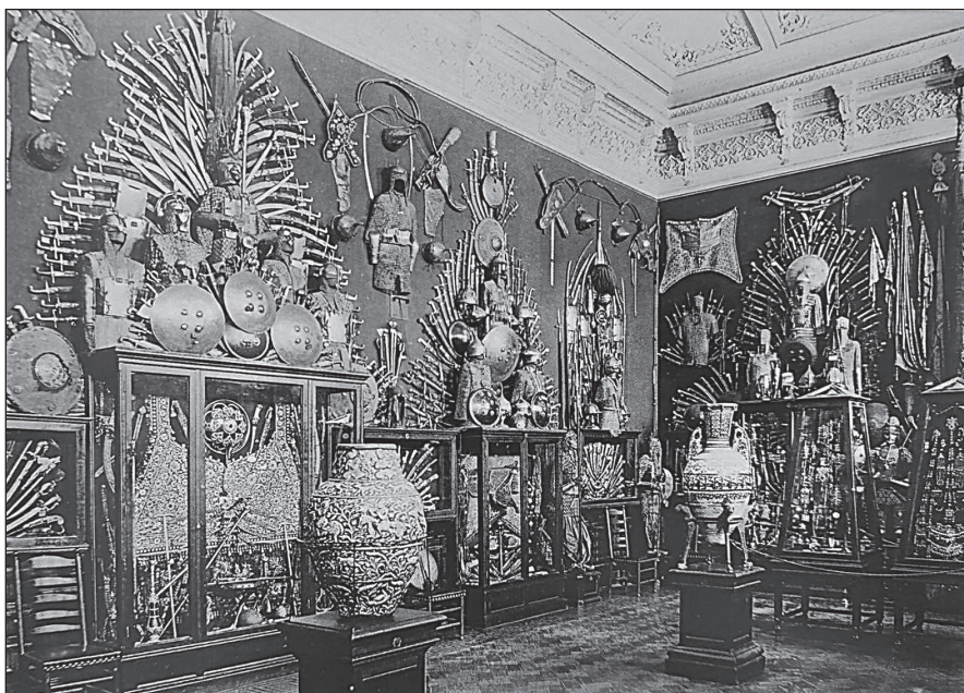
Рис. 1 Экспозиция Арсенала Отделения Средних веков и эпохи Возрождения в здании Старого Эрмитажа. Восточный зал. Конец 1890-х

Зал под номером 4 или «Восточная зала» — ныне Зал Совета — представлял собой экспозицию оружия Востока: Индии, Персии, Турции, Средней Азии и Кавказа (рис. 1). Кавказское оружие представлено было наравне с другим восточным и среди него. Размещено оно было вдоль стены, располагающейся напротив входной двери. Располагалось оно и в шкафу с предметами турецкого происхождения, и в шкафу с седлами, и в стенной витрине с оружием Персии и Кавказа, и в характерных для оружейных экспозиций XIX века трофеях 6 : в одном случае совместно с персидским оружием, в двух других — отдельно предметы вооружения кавказских горцев 7 . В небольшом 18 зале на постаментах было выставлено различное огнестрельное оружие, что являлось логическим продолжением 17 зала с кремневыми ружьями. Здесь среди персидских, турецких, индийских, арабских, китайских ружей экспонировались черкесская двустволка и дагестанское ружье имама Дагестана Гамзат-бека 8 .