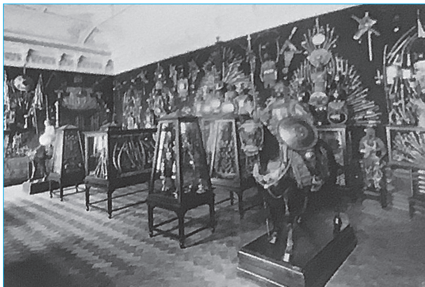
Рис. 2 Экспозиция отделения Средних веков и эпохи Возрождения в Императорском Эрмитаже. Зал восточного оружия в 1888–1915 гг. Фотография начала XX века