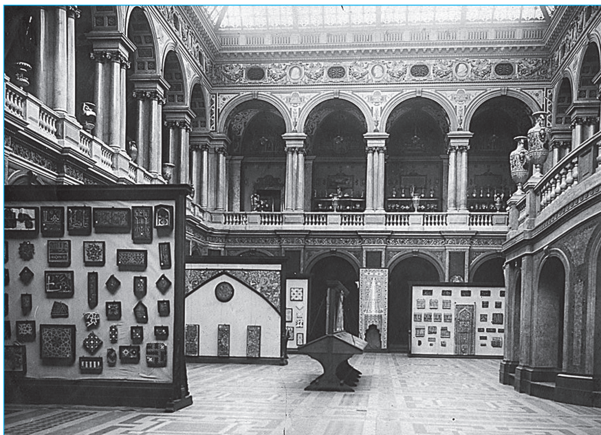
Рис. 3 Выставка мусульманских изразцов. Фотография. 1923 г.

Следующей эрмитажной временной выставкой стала выставка «Мусульманские изразцы», открывшаяся в 1923 г. 29 в большом зале первого этажа бывшего Музея Штиглица, переданного Эрмитажу летом того же года 30 . Выставка стала частью открытия всей экспозиции бывшего Музея Штиглица (I филиала Эрмитажа), на которой было представлено прикладное искусство Ближнего и Дальнего Востока, а также европейский фарфор 31 . Сохранилась общая фотография данной экспозиции (рис. 3), которая позволяет представить набор выставленных экспонатов и их размещение в большом зале музея. На выставке были представлены иранские, османские, среднеазиатские изразцы. Можно предположить, что среди иранских могли быть выставлены и несколько изразцов из ханаки Пир-Хусейна, которые поступили в Эрмитаж в 1915 г., и которые были в собрании Музея Штиглица. К сожалению, точно атрибутировать их по имеющейся фотографии затруднительно, однако данные изразцы являются прекрасными образцами кашанской (?) керамики, распространенной в XIII–XIV вв. на территории нынешнего Азербайджана, и на подобной тематической выставке они позволили бы проиллюстрировать продукцию одного из известных центров иранской люстровой керамики.