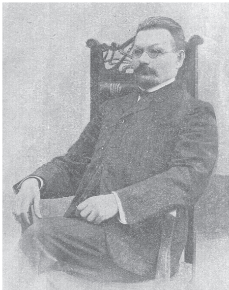
Рис. 6 По: Новорусский, 1920

Нельзя согласиться и с предложенной публикаторами атрибуцией мужчины, сидящего по левую руку от И.П. Мордвинова на фотографии со с. 108 и стоящего у правой двери на фотографии со с. 280 как М.В. Новорусского, известного революционера-народовольца и преподавателя Института в первые годы. Визуально мужчина с окладистой черной бородой и того же цвета шевелюрой не слишком похож на традиционно тиражируемый образ М.В. Новорусского, восходящий к фотографии дореволюционного времени (рис. 6) 7 . Да и выглядит он для почти шестидесятилетнего революционера, 19 лет проведенного в заключении в Шлиссельбургской крепости (1887–1906), слишком уж молодо.