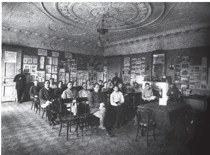
Рис. 5 По: Кох, Тургаев, 2023

самых разных научных интересов. Насколько мне известно, при рассмотрении ранней истории Института прежде ученые к нему не обращались, и это огорчительно, т.к. детальные, яркие, хотя и пристрастные описания повседневности Петрограда первой половины 1919 г. вообще и быта новосозданного учебного заведения, с которым на первых порах И.П. Мордвинов связывал весьма широкие чаяния, в частности, являются ценнейшим историческим источником. Полагаю, что в дневниковых записях сохранилось и свидетельство о том, как делались две рассматриваемые фотографии и кто оказался на них запечатлен.