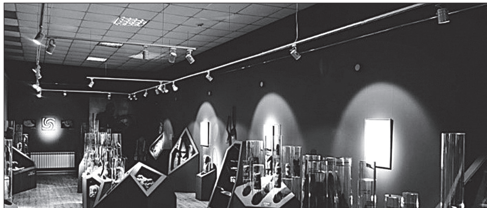
Рис. 1 Зал для демонстрации скульптур экспозиции «Трижды три неба» (Музей изобразительных искусств, г. Комсомольск-на-Амуре)

рыба—белая и пушистая», успех которого был подтвержден на федеральном уровне в конкурсе «Меняющийся музей в меняющемся мире» Благотворительного фонда Владимира Потанина в 2011 г. 11 Более 15 лет выставка успешно работала в формате «Школы древних мастеров» для детских групп, а теперь стала доступна всем 12 .