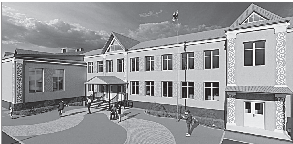
Рис. 3 Реновация фасада с использованием нанайского орнамента (с. Кондон)

Ее работа на тему «Влияние национальной культуры на особенности архитектуры и развитие средовых решений в экстерьере и интерьере» 25 была связана с разработкой малых архитектурных форм и интерьеров в средней общеобразовательной школе в селе Кондон. Кондон — это центр древней культуры Приамурья. В ходе работы было установлено, что в средовых решениях Кондона отсутствует системная классификация приемов использования национальной культуры. Это означает, что элементы нанайского наследия используются фрагментарно и бессистемно, не раскрывая его полного потенциала. Выпускница классифицировала основные подходы и приемы, которые влияют на отображение национальной культуры в архитектурном формообразовании, комплексно применила (рис. 3, 4) их на практике, разработав дизайн-проект для средового решения МБОУ Средней образовательной школы им. Акима Самара. Таким образом, работа перешла от теории к практике, предложив готовую методологию для архитекторов и дизайнеров, работающих в контексте культурного наследия.