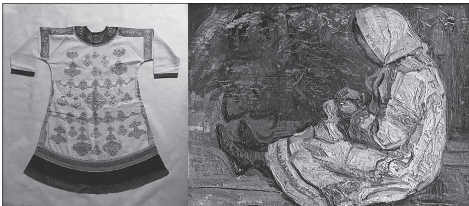
Рис. 2 Узоры на одежде

и выделке кожи. Как и в старину, они сшивают детали изделий вручную, при орнаментировании используют рыбий клей» 15 .