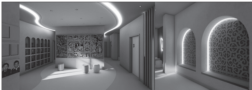
Рис. 4 Холл школы с использованием нанайского орнамента (с. Кондон)

Д.Г. Сохацкой и Д.Е. Шаруновой, позволяет напрямую обратиться к языку нанайской культуры. В разработке малых архитектурных форм использованы орнаменты, которые нанайцы применяют в отделке предметов быта и декоре некоторых архитектурных деталей жилого дома (рис. 5).