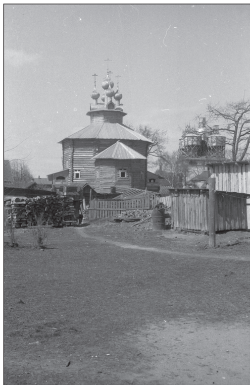
Рис. 4 Церковь Собора Богородицы на территории музея в 1960-х гг.

онной истории. Размещение храма на участке, не ставшем основной территорией музея, значительно усложняет организацию его использования в выставочной деятельности.