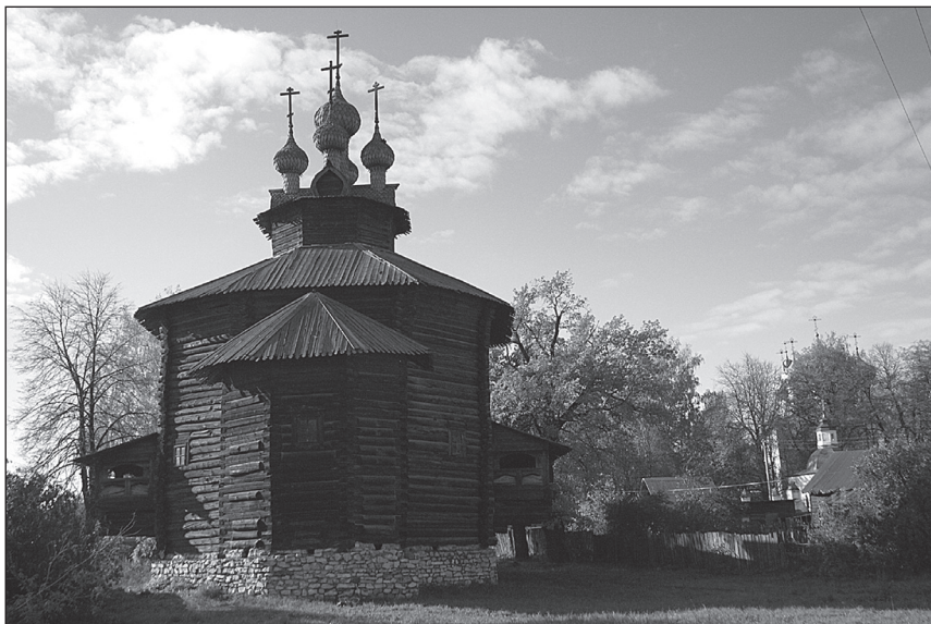
Рис. 5 Церковь Собора Богородицы на музейной территории

Церковь Собора Богородицы (рис. 5) была и остается одним из наиболее уникальных памятников русского деревянного зодчества, имеющих по-настоящему хрестоматийное значение для истории отечественной архитектуры. Современный музейный статус памятника — не только признание его неповторимости, но и возможность для гостей Костромы простого и удобного посещения сооружения и приобщения к архитектуре русского средневековья. Дальнейшее музейное использование одного из хрестоматийных памятников деревянного зодчества позволит раскрыть новые нюансы в восприятии наследия.