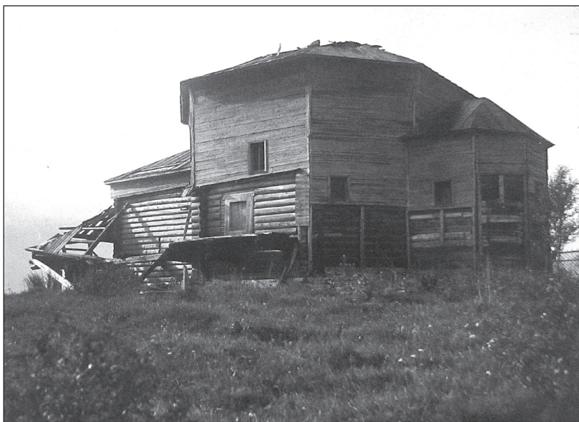
Рис. 2 Церковь Собора Богородицы в 1946 г. Село Холм

Вошедшие в состав экспедиции исследователи (С.Л. Агафонов, С.Я. Забелло, Л.В. Варзар, Е.П. Агафонова, Е.А. Белоусова) провели большую работу по изучению особенностей архитектурного и конструктивного решения здания. К примеру, открытием, сделанным учеными, является факт того, что «перекрытие основного восьмерика относится к типу так называемого ступенчатого деревянного свода» 14 . Срубленная «в реж» конструкция, по мнению исследователей, находит свои аналоги в «народном зодчестве Грузии, Армении, Северной Осетии <...> Этрурии, Малой Азии, Дальнего Востока» 15 . «Большой восьмерик перекрыт отступающими от плоскости стен внутрь здания горизонтальными венцами, создающими постепенное уменьшение перекрываемых пролетов» 16 .