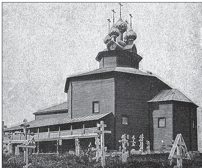
Рис. 1 Фото церкви Собора Богородицы начала XX века

часть представляет собой грузный низкий восьмимерик, заканчивающийся вверху чуть заметным повалом, над которым едва свешиваются скаты довольно крутой крыши, сходящиеся к низу второго восьмирика. Поперечник последнего очень мал в сравнении с поперечником нижнего; при этом и высота его не велика» 8 . При этом М.В. Красовский пишет: «Это несоответствие низа главной части с ее верхом указывает, быть может, на то, что храм имел первоначально другой вид. Действительно, вполне возможно, что нижний восьмимерик церкви был прежде гораздо выше и был покрыт шатром, но впоследствии, вероятно, в начале XVIII века, подвергся по какой-то причине перестройке и получил тогда свой нынешний облик». Исследователь аргументирует свою гипотезу следующими фактами: «Это предположение находит себе подтверждение в местном предании, относящем сооружений храма к 1552 году. Конечно, такая давность преувеличена, но если даже мы ее уменьшим на сто лет, то все же предположение наше не изменится, так как в середине XVII века большинство храмов строилось шатровыми» 9 . Упоминает храм и И.Э. Грабарь в своем обобщающем издании по истории русской архитектуры 10 .