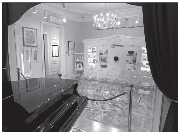
Рис. 3 Центральная интерактивная витрина в зале «Мировая слава»