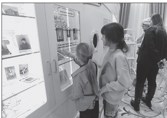
Рис. 6 Посетители изучают экспонаты через сенсорные интерфейсы в зале «Мировая слава»