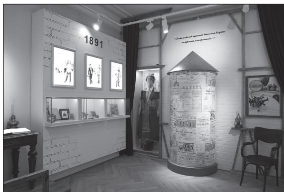
Рис. 2 Сценографическое решение зала «Дебют и бенефис»