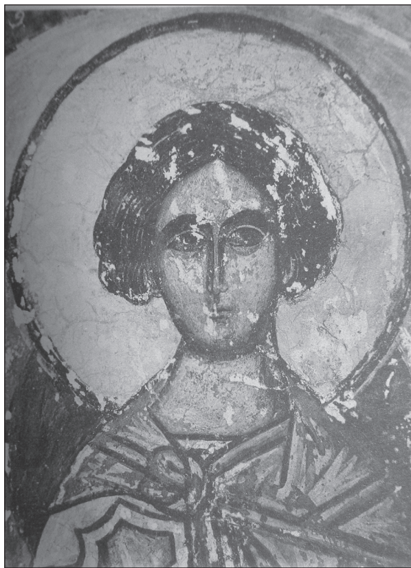
Рис. 5 Святой Лавр. Фреска Николаевской церкви в Гостинополье. 1460-е—начало 1470-х. Фотография 1914 г.

из примечаний к статье Н.И. Репникова 34 . Опущена была лишь ее заключительная часть, в 1921 г. утратившая актуальность: «...считаю своим долгом сообщить, что дальнейшее пребывание фресок в настоящем состоянии опасно, о чем мною своевременно и было указано причту и старосте, которые и выразили желание открытие фресок поручить мне. Вследствие этого убедительно прошу Высочайшей Комитет разрешить произвести мне выше означенную работу (курсив наш — Н.П.) 35 . Продолжения раскрытия фресок не последовало, в 1942 г. церковь была разрушена 36 . Остается с горечью процитировать слова Н.И. Репникова, написанные 110 лет тому назад: «После полной расчистки, росписи Гостинопольного (так!) монастыря займут в русской науке живописи почетное место, и думается, что в них придется видеть представителей древнейшей чисто русской стенописи; они являются единственными покуда представителями той иконописной школы, которая была “эпохой величайшего расцвета русской иконописи”» 37 .