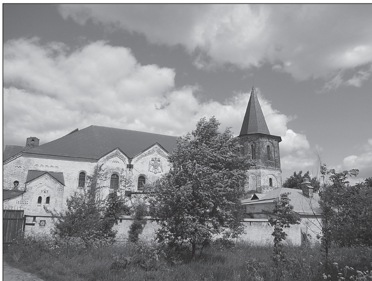
Рис. 2 Ратная палата в Царском Селе. Фотография 2010 г.

Предварительные итоги работ по раскрытию образа были подведены А.И. Кудрявцевым уже в декабре 1927 г. на заседании Разряда Русской живописи Государственной академии истории материальной культуры 15 . Доклад был посвящен не столько технической стороне дела, сколько размышлениям автора о датировке образа из Русского музея и другой древней иконы того же сюжета из новгородской Николо-Кочановской церкви. Обе иконы докладчик относил к XV в. Следует отметить, что участники дискуссии по докладу не одобрили такой поспешности А.И. Кудрявцева и предлагали отложить решение вопроса о датировке иконы до окончания ее раскрытия. В то же время, анализ иконографии иконы из Русского музея привел А.И. Кудрявцева к убедительному заключению о ее создании для церкви святителя Николая, чей медальонный образ вписан в верхний регистр композиции, и, одновременно, о связи этой детали с круглой иконой из новгородского Николо-Дворищенского собора.