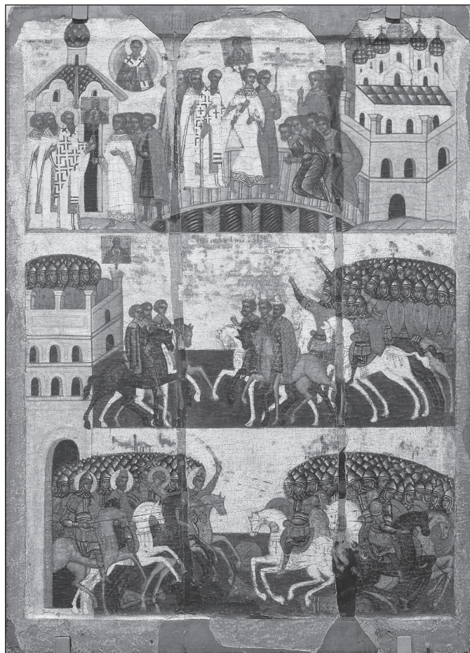
Рис. 1 Икона «Битва новгородцев с суздальцами». Из Николаевской церкви в Гостинополье. Конец XV в. ГРМ