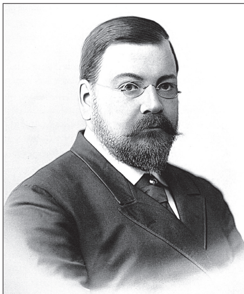
Рис. 4. Николай Владимирович Султанов (1850–1908)

по рисункам зодчего исполняла ювелирная фирма И.П. Хлебникова. Неожиданное отражение творчество Н.В. Султанова получило в текстиле российского производства. Известно, что изображение памятника Александру II в Московском Кремле, одним из авторов которого был Султанов, воспроизводилось на платках Даниловской мануфактуры 17 .