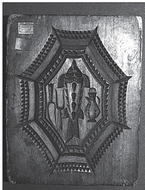
Рис. 2. Пряничная доска. Городец. II половина XIX века (инв. № Д-762)

многократно усложнялась восьмиугольной формой обрамления, он сумел создать уравновешенную композицию. Городецкий исследователь А.Н. Еранцев датирует такие доски второй половиной XIX в. Он пишет: «Во второй половине XIX века в связи с быстрой ломкой старого патриархального крестьянского быта круг мотивов на пряничных досках значительно расширился. Резчики все чаще стали украшать свои изделия изображениями разных бытовых предметов. Поскольку пряники были частью застольной церемонии, на печатных досках появились изображения пирогов, кувшинов, ножей и вилок, накрытых столов с самоварами и чайными приборами (или с винными бутылками, штофами и рюмками)» 4 .