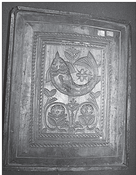
Рис. 1. Пряничная доска. Городец. II половина XIX — начало XX века (инв. № Д-761)