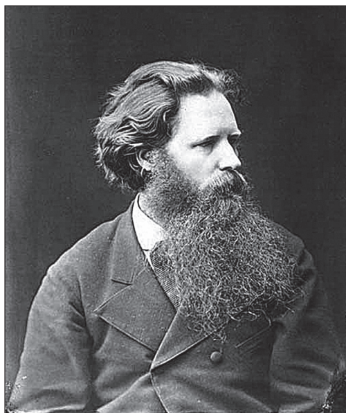
Рис. 6. Андрей Осипович Карелин (1837–1906)

Н.В. Султанов был приглашен в 1895 г. для реставрации башни Нижегородского кремля, в которой позднее был открыт Нижегородский городской художественный и исторический музей 25 . Архитектор длительное время общался с А.О. Карелиным как с одним из создателей музея. Он видел собранные фотографом произведения народного искусства.