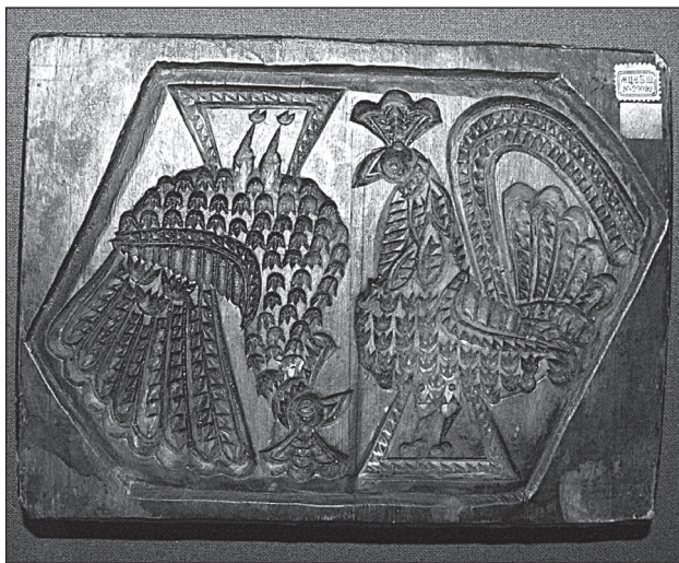
Рис. 3. Пряничная доска. Городец. II половина XIX — начало XX века (инв.№ Д-725)

мощного промысла с длительной историей. Об этом свидетельствует не только уверенная, профессиональная работа резчиков, но и устойчивость декоративных мотивов и композиций пряничных досок 7 . Мастера прекрасно расположили сложные изображения в прямоугольных рамках. Кроме того, изображения созданы на основе комбинации постоянных мотивов: «копытцев», «елочек», зубчатых линий и т.д. Доски могут датироваться второй половиной XIX — началом XX вв., наиболее вероятное место происхождения — село Городец Нижегородской губернии.